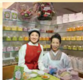
やさしい生食ばんアイリス店