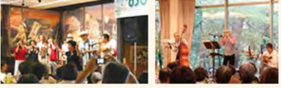
グランパ&グランマおひさまコンサート in みーるマーマ 社長がベース、ふるかたがピアノ 伊那食品工業かてんホール

現在も多くのお客様から「いつマーマはオープンするの?」「早い復興を祈っています」と激励のお声をいただいております。とてもありがたいです。私たちみーるマーマスタッフも欠けることなく、元気に他の事業所で勤務しています! まだレストランをオープンするまでには時間はかかりますが、現在は伊那、長野、松本、茅野、上田など各地を回りながら、コンサートを開催する予定で活動しております。