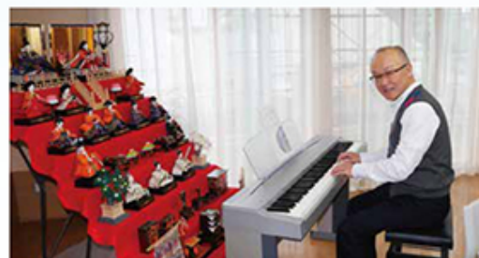
施設にあったオルガン。離人形の前で華やかに

わないとわからない。やはり、探究心と挑戦力は必要だと思います。 ■若い人に今、伝えたいなら 「なんでも良いから1つの事を長く続ける」。そうすると人脈が広がったり、人と話をする時に自然と会話弾んで助かるなど役に立つ。 また、若い時はエネルギーがある。今思えばもっとエネルギーを使うべきだった。その時しかできない体験を、できるだけたくさん行って楽しむことが大事です。