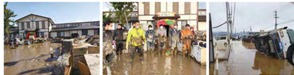
グランドピアノも泥まみれ 産る場所もない、全てが泥と水 翌日も水が引かない国道