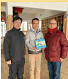
福島ひまわり募金