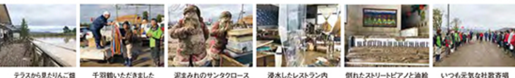
テラスから見たりんご畑 千羽鶴いただきました 泥まみれのサンタクロース 浸水したレストラン内 倒れたストリートピアノと油絵 いつも元気な社歌斉唱

シユな力のおかげで、次第に復旧が分散していき、本社機能を失わずに済みました。あの時は給料日が近かったので心配しましたが、1600人の給与が無事に払えて安堵したのを覚えています。