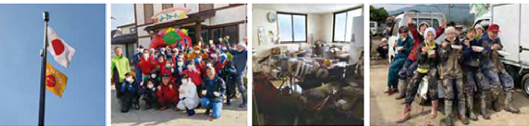
掲げつつける社旗と国旗 たくさんのボランティアの人たちと 水圧で天地逆転 みんなと食べる昼食は美味しい！

あの状況で一番嬉しかったのは、大勢の人が応援に来てくれたことでした。また週末になると、東京や全国各地からボランティア活動に来て下さいます。埼玉県に勤務している女性社員は、「何も考えずに、ただたただ行かなくちゃー」と思い立ち、新幹線と在来線を使い継いで来てくれたとお聞きし嬉しくなりました。また他にもお取引している業者の人たちが大勢来てくださいました。マスクや食料、掃除道具もすべて持参して、ボランティアで手伝いに来てくださった方や