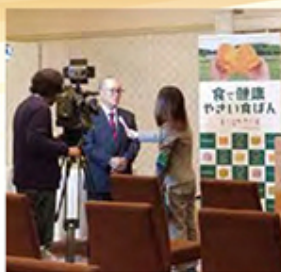
「やさしい生食ばん」のプレス発表