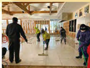
綺麗になったみーるマーマ店内