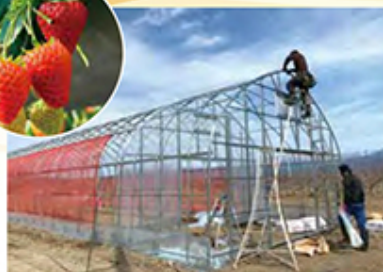
ヴィレッジ復興の証 イチゴハウスの建築は進む