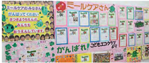
全国から頂いた嬉しい応援メッセージ

したら良いのか? しっかり考えなくてはいけないと思い、今計画していることがあります。 — それは何ですか? — やさしいばんの製造工場です。まずはHACCP「認証」を取得して、次は「米国HACCP」認証することです。今まで以上に安心安全なパン作りをして、世界の子どもたちに「美味しいパンを届けよう!」とあらためて力を入れています。 他にもアレルギー、グルテンフリーの商品を今まで以上に生み出していきたいですね。少し時間はかかると思いますが、それも今計画しているところですよ。 — イチゴハウスの再建と学び — 復興の第一歩として現在取り組まれているのが、建築から3年経たずして災害で流されたしまったイチゴハウスの再建です。今回は50mの長いハウスで、作業効率もこれまでより